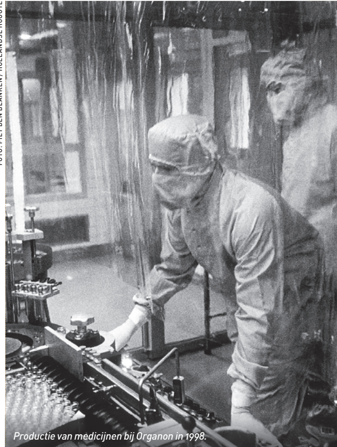
Productie van medicijnen bij Organon in 1998.