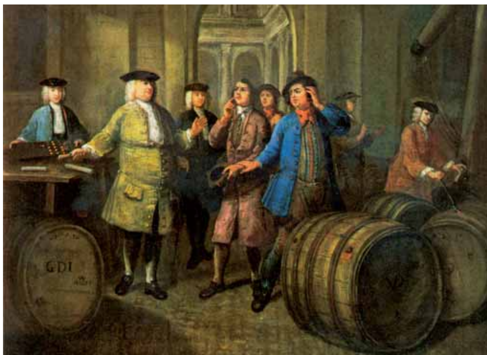
Een Rotterdamse koopman onderhandelt met meekraphandelaars over een partij meekrap rond 1757