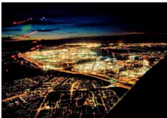
Concentratie van (petro)chemische industrie bij Europoort

Van groot belang is de uitvinding van het laboratorium geweest. Terwijl andere disci-