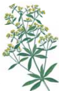
Onooglijk, maar nuttig plantje meekrap

sten en Weetenschappen in 1784 een prijsvraag uit waarin werd gevraagd 'welke de eigenlijke Oorzaken zijn, waarom de Scheikunde bij onze Nabuuren, en vooral bij de Duitschers, in meer aanzien, en algemeener beoefening is, dan in ons Vaderland?'