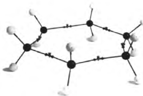
Figuur 1 | Kekulé model van de door Baeyer voorgestelde structuur van cyclohexaan.